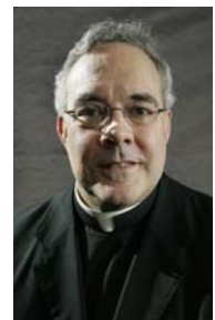
Piše: Oče Robert Sirico