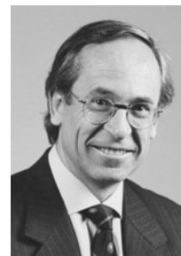
Intervju: José Piñera