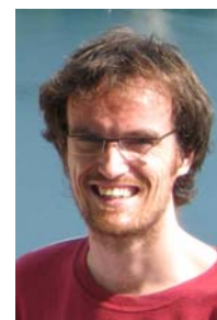
piše: Mitja Steinbacher

:: Tržnica brez vizije, jasnosti in poguma